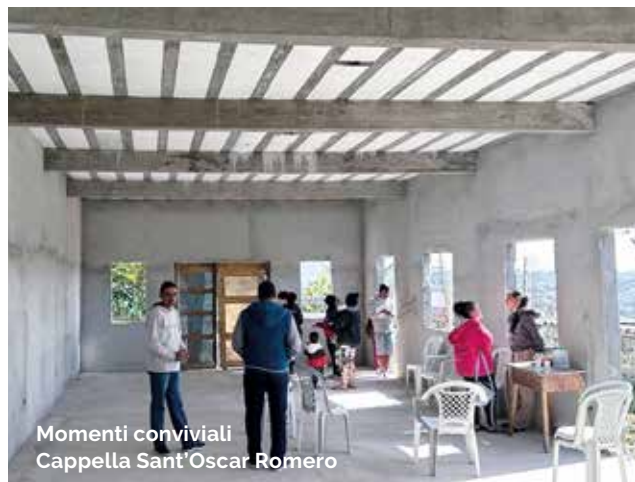
Momenti conviviali Cappella Sant'Oscar Romero

NOTIZIE: PROGETTO MISSIONARIO SANT'OSCAR ROMERO – BRASILE