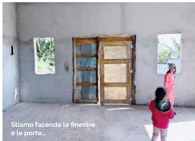
Stiamo facendo le finestre e le porte...

Siamo infinitamente riconoscenti alla comunità della Missione di Baden-Wettingen che ci ha permesso di vedere una parte del sogno realizzato. Siete sempre nelle nostre preghiere e nel nostro cuore.