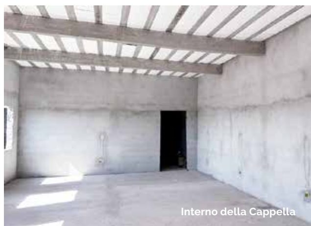
Interno della Cappella

Se oggi è possibile vivere anche questa gioia grande e avere un tetto sopra la testa della comunità è grazie alla generosità dei fratelli e sorelle della Missione di Lingua Italiana di Baden – Wettingen.