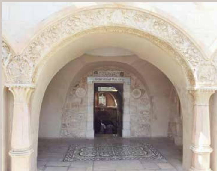
Betlemme : Grotta del latte

Santa Maria, donna coraggiosa, non lasciarci abbattere dalle avversità. Aiutaci a portare il fardello delle tribolazioni quotidiane. Siediti sui nostri sconsolati marciapiedi e ripetici parole di speranza.