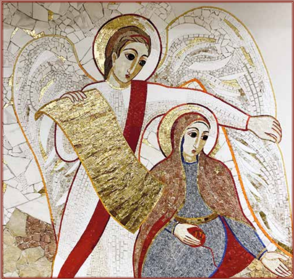
Capiago (CO) – Casa Incontri Cristiani – Mosaico: L'Annunciazione

Periodico delle Missioni Cattoliche di Lingua Italiana dell'Argovia • N° 5-2023