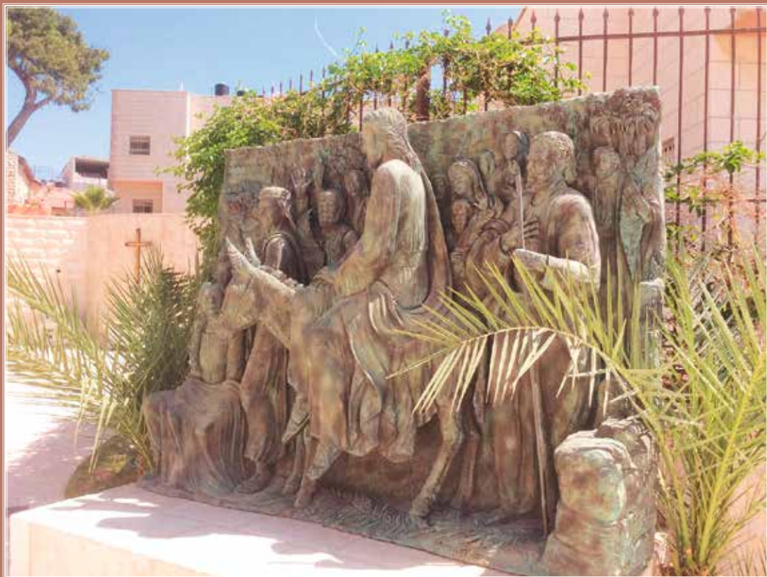
Terra Santa: Monte degli ulivi, Betfage, scultura bronzea

Periodico delle Missioni Cattoliche di Lingua Italiana dell'Argovia • N° 2-2024